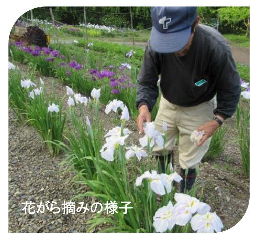
花がら摘みの様子

矢作町二又地区に陸前高田の名所があることをみなさんご存知でしょうか?6月下旬~7月頭にかけて、約2,500株(約50種類)の色とりどりのあやめが咲く『あやめ園』。