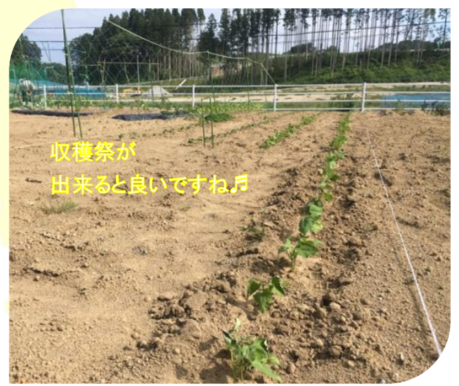
収穫祭が出来ると良いですね!

これからが楽しみですが、まずは鳥獣防護柵の設置が最優先とのこと。早く設置されますように...(酒井)